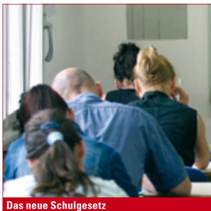
Das neue Schulgesetz