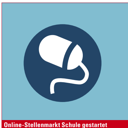
Online-Stellenmarkt Schule gestartet