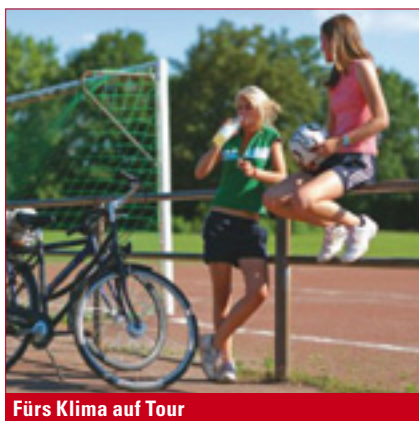
Fürs Klima auf Tour