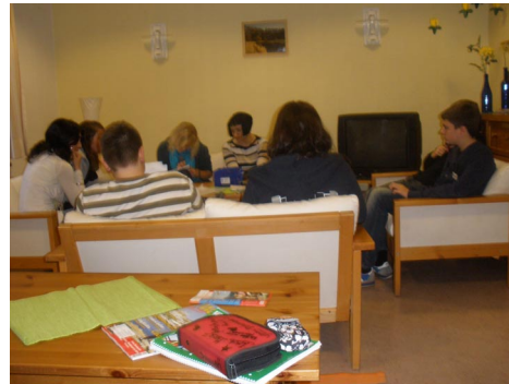
( AG „Sucht und Suchtprävention“ )

Durch frühen Kontakt mit Computern und Konsolen kommt es bei vielen jungen Leuten, aber auch älteren Menschen zu einer Spielsucht. Bei den jungen Betroffenen sind es meist die Konsolen und Computer, bei den Älteren ist es meist der einarmige Bandit. Auch wenn es zuerst keine Anzeichen gibt, kommt nach einiger Zeit immer mehr das Verlangen nach dem Spielen.