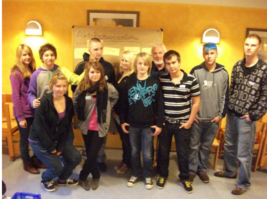
Die Jugendlichen der AG „Rechtsextremismus“

Bei der Veranstaltung „Jugend im Kreistag“ diskutieren Jugendliche über Rechtsextremismus.